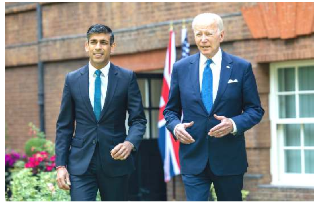
according to British officials. "Our new prohibitions on key

The intent is to limit Russia's revenues from metals, they say, as metals have earned the nation $40 billion in the past two years,