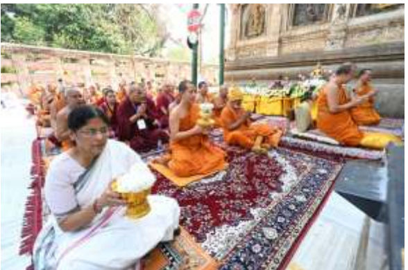
Page 3 News