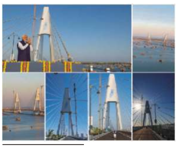
पेज 3 न्यूज़ / संवाददाता अहमदाबाद / 25 फरवरी

प्रधानमंत्री ने गुजरात में ओखा मुख्य भूमि और बेट द्वारका द्वीप को जोड़ने वाले सुदर्शन सेतृ का उद्घाटन किया