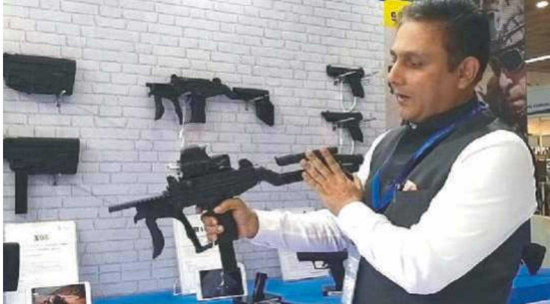
यूनिट तैयार हो गई है। करीब 1500 करोड़ से तैयार इस स्माल कैलिबर एम्यूनेशन मैन्युफैक्नरिंग प्लांट में मार्च से तोप-गोले और हैंड ग्रेनेड का उत्पादन शरू हो

कानपुर डिफेंस कॉरिडोर में अदाणी समूह की डिफेंस इकाई तैयार हो गई है। 200 हेक्टेयर में बनी इस इकाई में तोप से लेकर ड्रोन, हथियार और गोला बारूद बनेंगे। यहां शॉर्ट रेंज मिसाइलें भी बनाई जाएंगी। 26 फरवरी को मुख्यमंत्री योगी आदित्यनाथ इस प्लांट का उद्घाटन करेंगे। ये एशिया की सबसे बड़ी गोला-बारूद निर्माण इकाई है। इस अवसर पर अदाणी ग्रुप के एमडी और गौतम अदाणी के बेटे करण अदाणी भी मौजूद रहेंगे। रक्षा क्षेत्र में आत्मिनिसरों हो सुनापी होने पहनी साई स्थित डिफेंस